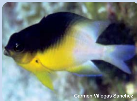
Carmen Villegas Sanchez

La connaissance détaillée de la dispersion des larves dans l'espace, appelée également 'l'enveloppe de dispersion', pourrait aider à déterminer si: (i) la taille d'une réserve garantirait l'auto-recrutement, (ii) l'emplacement et l'espacement des réserves favoriseraient le maintien des populations ciblées par la dispersion entre elles, et (iii) la taille, l'espacement et le placement d'un réseau de réserves seraient de maximiser les avantages potentiels de la pêche sur les zones de pêche voisines par une augmentation du recrutement. Notre connaissance des 'enveloppes de dispersion' est limitée pour deux raisons ; premièrement, car les modes de dispersion des larves sont spécifiques en fonctions des espèces, du site et du temps. Deuxièmement, car ces modes sont déterminés par un processus complexe au niveau comportement, physique et hydrodynamique.