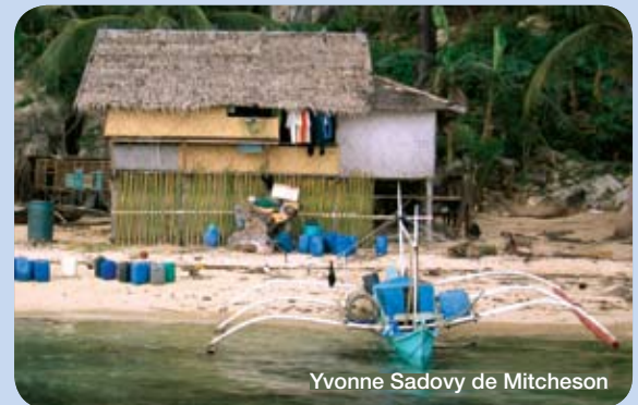
Yvonne Sadovy de Mitcheson

Pour la construction d'un programme de gestion intégrée, il faut aussi inclure la valeur ajoutée certaine apportée par une réserve.